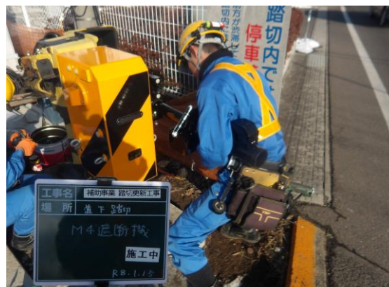
【踏切設備】道下踏切更新工事 遮断機更新状況