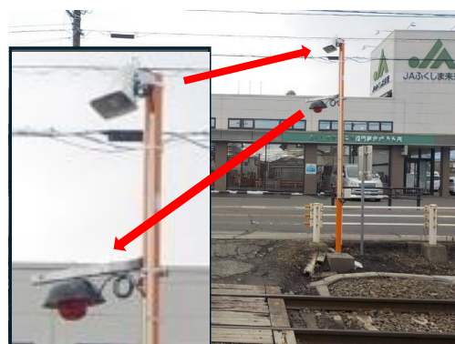
【第4種踏切対策】 閃光灯・警報機の設置