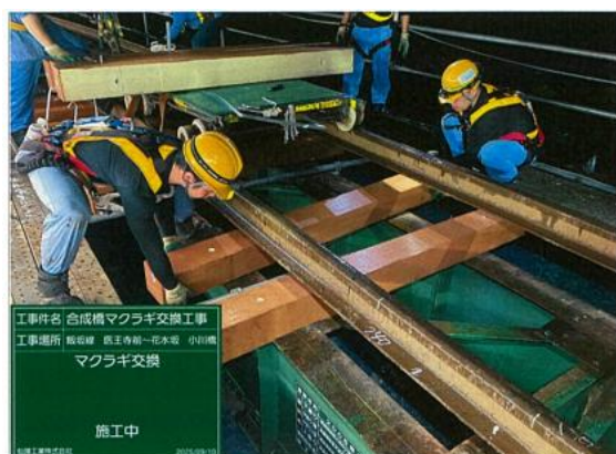
【線路設備】小川橋りょう合成化工事状況