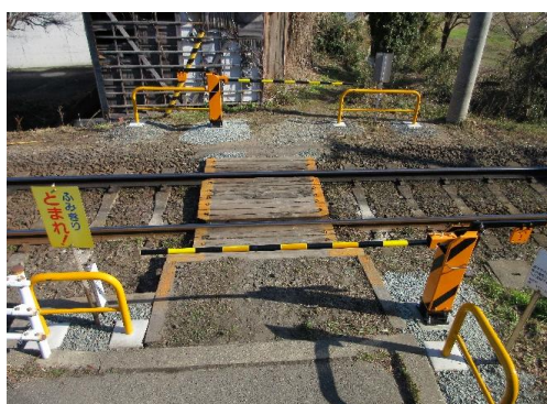
【第4種踏切対策】 稲荷田踏切手動ゲート設置