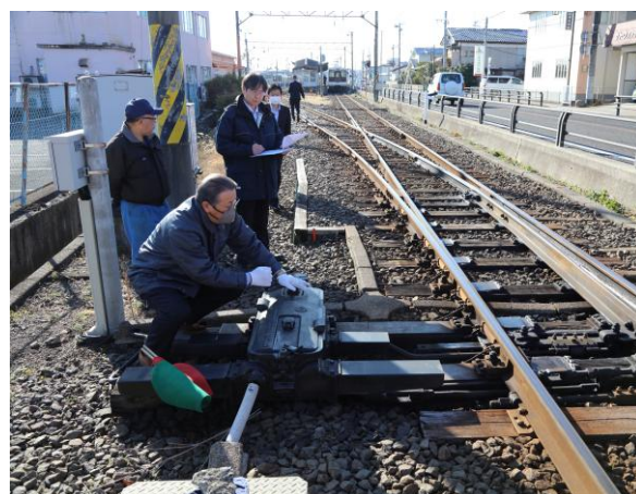
代用閉そく実地訓練