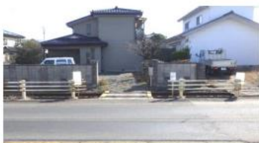
【施工前】第4種踏切 (No. 47)カーブミラー・看板設置箇所