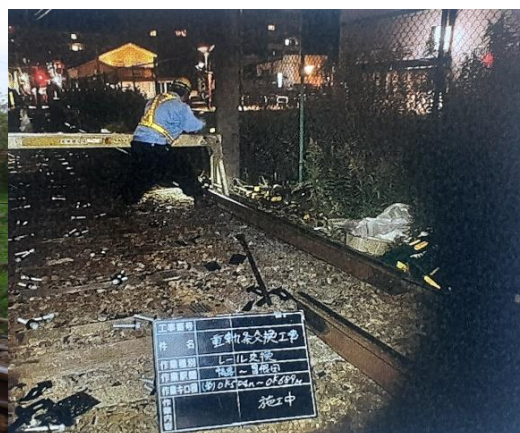
重軌条化(レール交換)工事