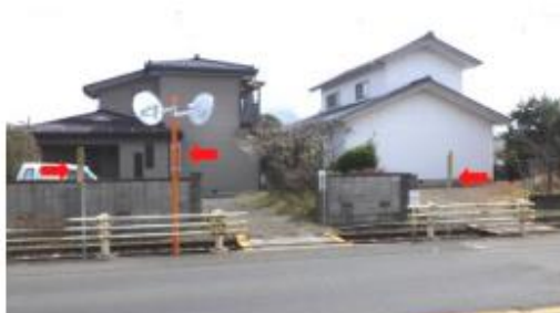
【施工後】第4種踏切 (No. 47)カーブミラー・看板設置箇所