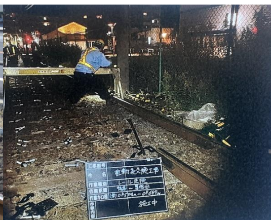
重軌条化(レール交換)工事

※踏切保安設備の更新工事については、電子機器の納入遅れ等により次年度に繰り越して工事を行なっております。