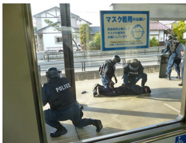
テロ対策合同訓練