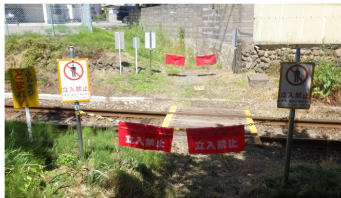
道添踏切 仮閉鎖状況